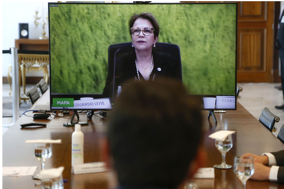
Encontro com o Ministério da Agricultura, Pecuária e Abastecimento.

EMPREGO – Para além do investimento direto trazido através da movimentação na economia, o Estado também é beneficiado pelo