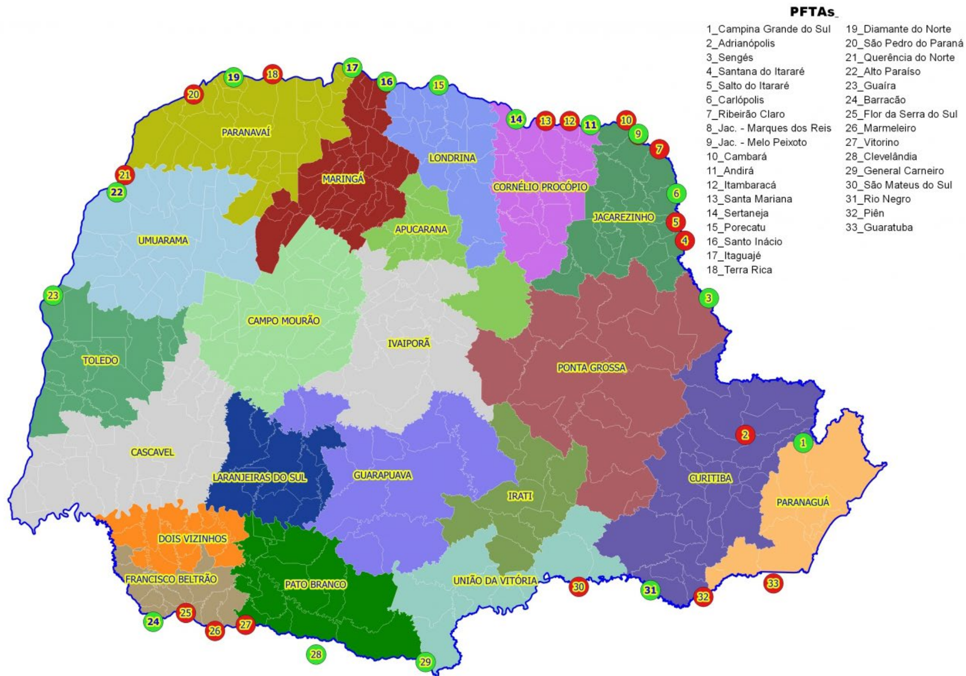
Localização dos Postos de Fiscalização do Trânsito Agropecuário Sistema de Postos de Fiscalização