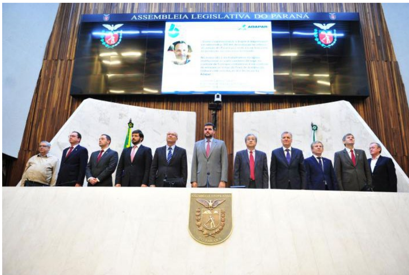
Sessão solene comemorativa aos 6 anos da ADAPAR, por proposição do deputado Pedro Lupion (DEM).

A Assembleia Legislativa do Paraná promoveu ao final da tarde desta segunda-feira (7) uma sessão solene especial para comemorar os seis anos de criação da Agência de Defesa Agropecuária do Paraná – ADAPAR, autarquia encarregada de promover a defesa agropecuária e a inspeção sanitária dos produtos de origem animal, a prevenção, o controle e a erradicação de doenças dos animais e de pragas dos vegetais de interesse econômico ou de importância à saúde da população, além de assegurar a segurança, a regularidade e a qualidade dos insumos de uso na agricultura e na pecuária. A solenidade e as homenagens à empresa vinculada à Secretaria de Estado da Agricultura e Abastecimento atenderam a proposição do deputado Pedro Lupion (DEM), líder do Governo no Legislativo, aprovada por unanimidade pelos deputados estaduais.