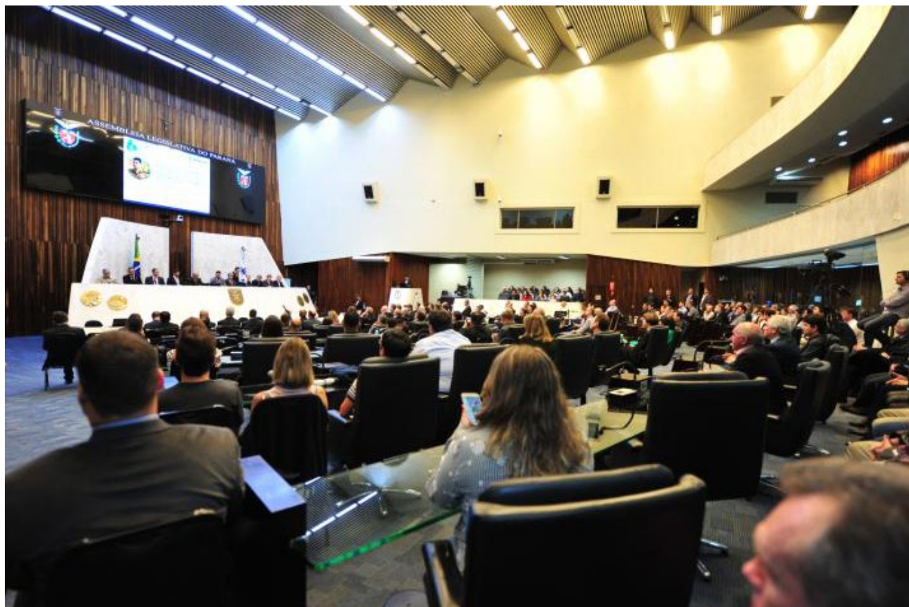
Sessão solene comemorativa aos 6 anos da ADAPAR, por proposição do deputado Pedro Lupion (DEM).

Para tanto, são apontadas como decisivas as ações da autarquia voltadas para a difusão de informações educativas sobre sanidade animal e vegetal; o registro e controle de documentos como os de certificação de sanidade; a fiscalização da inspeção em frigoríficos e indústrias de derivados de carne e de laticínios; a fiscalização da adoção de medidas de prevenção e controle da sanidade animal e vegetal nas propriedades rurais; a fiscalização do trânsito de animais, produtos de origem animal e vegetal e de insumos para utilização na agropecuária; ou a fiscalização granjas, de incubatórios avícolas, institutos de sementagem, chocadeiras e de galpões onde se faz o manejo do bicho-da-seda (sircarias); entre outras.